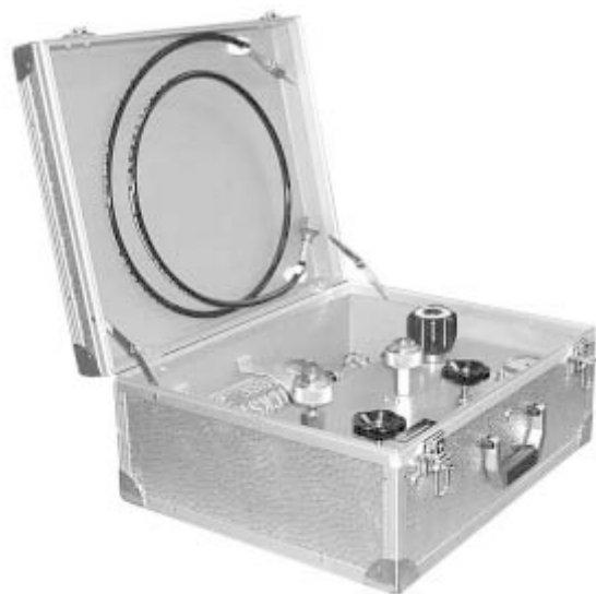
Чемодан для создания давления