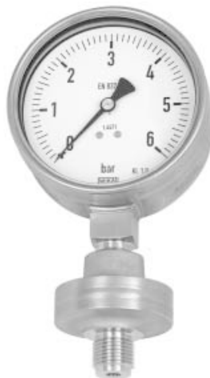
Разделитель, Экономичная конструкция Модель 990.38 с манометром Модели 232.50 HP 100