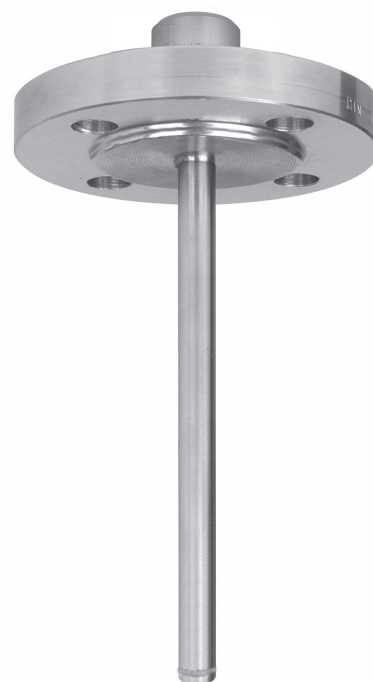
Poço de proteção com flange SW550F

Øext 13,7 mm, Øint 9,3 mm (¼" Sched. 40)